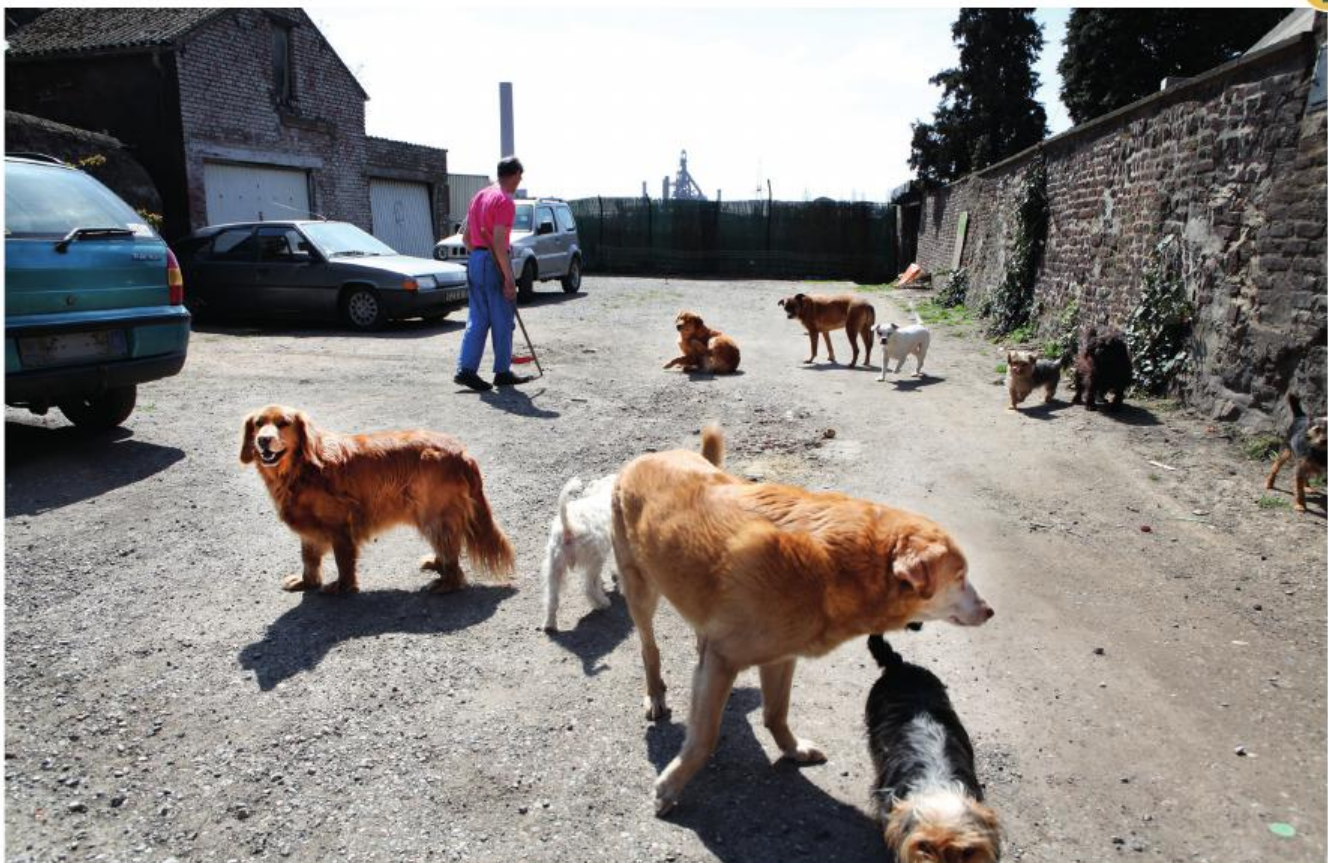
■ Foto uit de campagne 'Armoede (op den) buiten' uit 2013 van Welzijnszorg.

Niets mis uiteraard met inspanningen om armoede en vooral dan de strijd ertegen historisch te duiden. Het is daarbij ook altijd nuttig om in samenwerking met een organisatie van mensen die in armoede leven een actueel luik aan het project te breien. In het bijzonder input van ervaringsdeskundigen, in het vakjargon mensen met armoede-ervaring , moet inzicht bieden in de armoedeproblematiek en het lokaal zichtbaar maken. Ik doe geen afbreuk aan de waarde van dergelijke projecten. Integendeel, ze hebben als doel om mensen bewust te maken en het resultaat kan in het onderwijs worden ingezet. Vanuit het perspectief van de erfgoedorganisatie is een