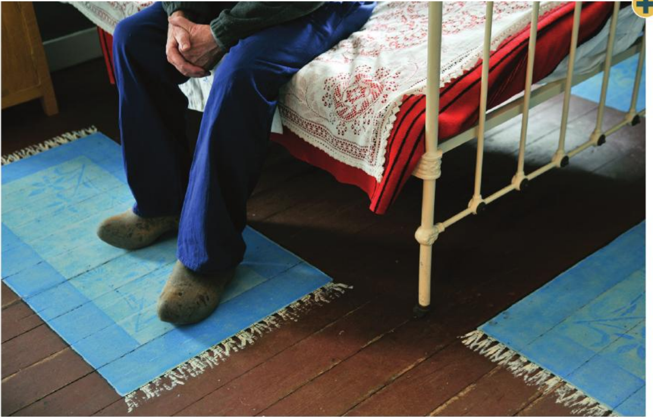
■ Slaapkamer met geschilderde tapijtjes. Collectie: Museum van de Mijnwerkerswoning, Eisden

matiek ontstonden dan ook de eerste zelforganisaties. Het zijn de voorlopers van de huidige ‘verenigingen waar armen het woord nemen’. 13 Dit zijn verenigingen die zes objectieven hebben: armen samenbrengen in groep, armen het woord geven, werken aan de maatschappelijke emancipatie van armen, werken aan maatschappelijke structuren, vormingsactiviteiten en de dialoog organiseren en armen blijven zoeken. De 59 door de Vlaamse overheid erkende ‘verenigingen waar armen het woord nemen’ zijn op hun beurt verenigd onder de koepel van het Vlaams Netwerk van verenigingen waar armen het woord nemen, beter bekend onder de naam ‘Netwerk tegen armoede’. De koepel ondersteunt de verschillende verenigingen op velerlei gebied, is het aanspreekpunt voor de overheid, doet aan beleidsbeïnvloeding, sensibiliseert rond de armoedeproblematiek en werkt actief aan de verbetering van de beeldvorming rond mensen in armoede en het wegwerken van vooroordelen. 14 Het uiteindelijke doel van het Netwerk tegen armoede is de uitbanning van armoede en sociale uitsluiting.