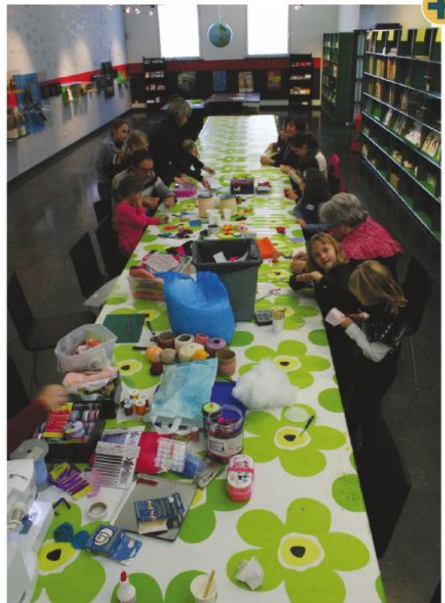
■ Achter de inkombalie in het Stedelijk Museum Aalst staat een grote tafel waar mensen kunnen zitten, lezen, babbelen. Er zijn kranten en tijdschriften ter inzage en ook de uitgebreide museumbibliotheek is raadpleegbaar.

Tegelijk wordt deelname gestimuleerd door het puntensysteem: bij elke check-in sparen bezoekers punten die ze op verschillende plaatsen kunnen omzetten in voordelen. Uit de evaluatie van het proefproject in Aalst bleken vooral de fysieke voordelen mensen in armoede aan te spreken: verrassingsvoordelen, drankbonnetjes, jongleerballetjes. Omruilvoordelen die inzetten op drempels zoals vervoer of een leuk gadget worden ook benut. 12 Het puntensysteem van de UiTPAS speelt ook in het voordeel van ‘t Gasthuys. Bij ►