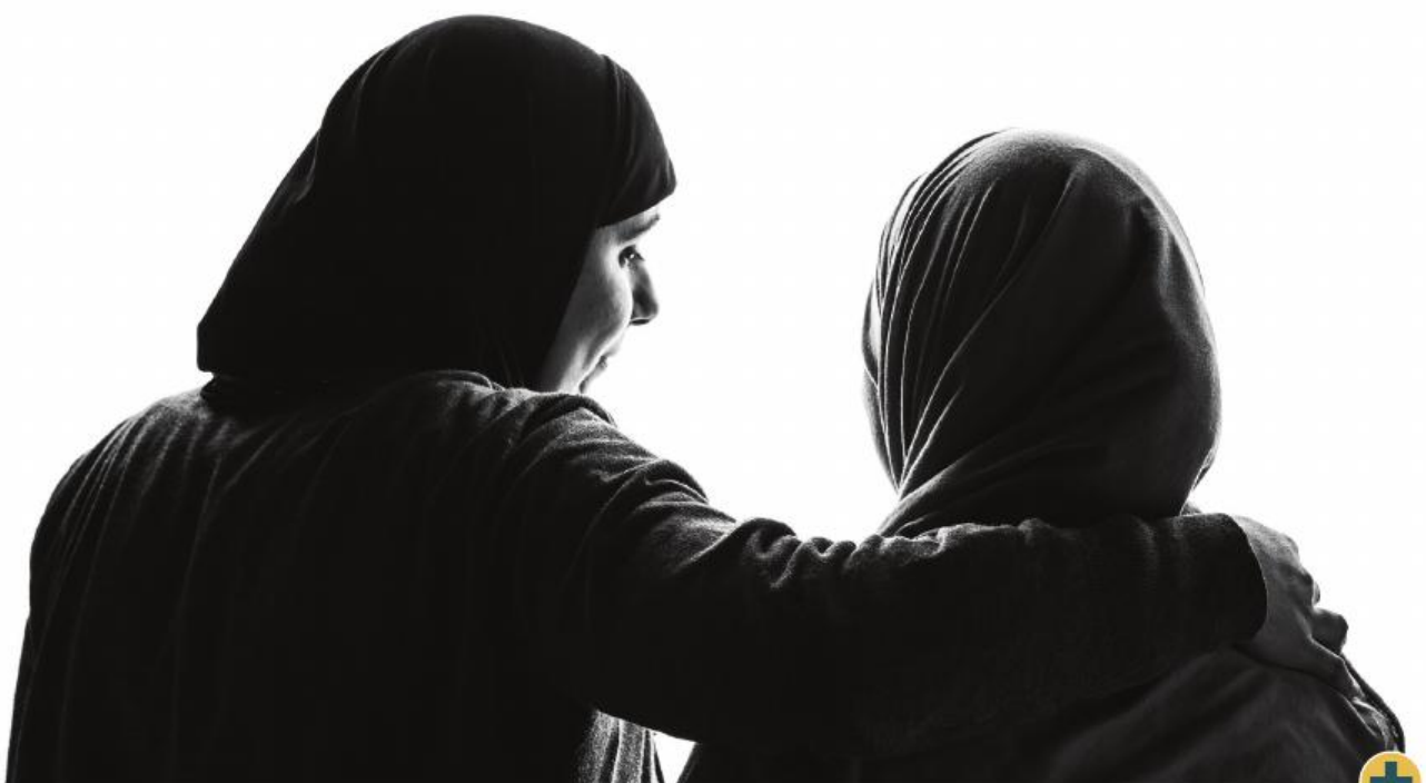
■ Cursisten NT2 die meewerkten aan 'Mijn verhaal' van het KMSKA.

Hoe kunnen erfgoedorganisaties bijdragen aan de bestrijding van armoede? Anno 2015 is de armoedesituatie immers helemaal niet duurzaam verbeterd, ondanks een toename van de welvaart. Enkele bijzonder kwetsbare doelgroepen vallen op, zoals kinderen, 65-plussers en personen met een niet-Europese nationaliteit. Maar armoede is ook een netwerk van mechanismen van sociale uitsluiting in domeinen die niet altijd opvallen zoals tewerkstelling, gezondheid, vrije tijd, onderwijs, huisvesting enz. Hoe dragen erfgoedorganisaties zorg voor mensen in kwetsbare situaties? Hoe kunnen instrumenten zoals de UiTPAS en de lokale netwerken ook nuttig zijn voor erfgoedorganisaties? We namen de proef op de som en bezochten enkele organisaties: het Koninklijk Museum voor Schone Kunsten Antwerpen (KMSKA), het Museum Plantin-Moretus, het Gasthuys – Stedelijk Museum Aalst, Musea Brugge en het Brugs Netwerk Vrijetijdsparticipatie (een samenwerking tussen het Stadsbestuur en het OCMW). Inge Vandewalle van Demos gaf toelichting bij de lokale netwerken. 1