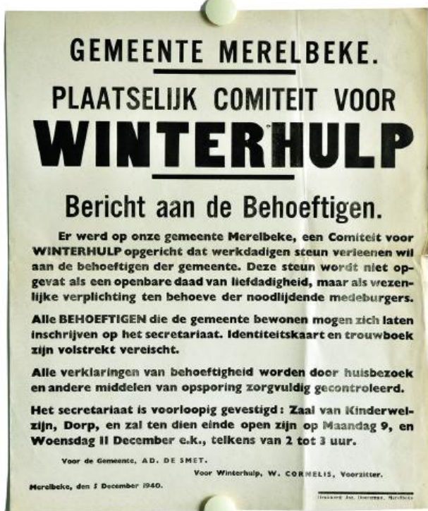
■ Winterhulpaffiche uit WOII, 1940.

Naast het verzamelen van statistieken over armoede hebben de wetenschappers die zich sinds de jaren 1970 wijdden aan het armoedevraagstuk nog een bijkomende verdienste. In hun drang om beter zicht te krijgen op wat het betekent om arm te zijn en als arme door het leven te gaan zijn ze namelijk gaan praten met de armen zelf. Via kwalitatieve onderzoekstechnieken hebben ze de armen letterlijk een stem gegeven. En dat was nodig, want voordien waren de armen de stemlozen bij uitstek, een restcategorie in de statistieken waar de goegemeente en het beleid liefst in een brede boog omheen liepen. Dat mensen in armoede meer zijn dan louter steuntrekkers en pas zwaarder zouden wegen op het beleid als ze zich zelf gaan organiseren en hun stem laten horen, dat beseften ze zelf ook. In dezelfde periode als de hernieuwde wetenschappelijke belangstelling voor de armoedeproble-