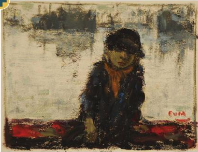
■ Havenboefje aan de Scheldekaai door Eugeen Van Mieghem (1875-1930).

Niet alleen door bepaalde stellingen die gepaard gaan met de andere verklaringsmodellen te ontcrachten of te nuanceren, maar ook door te wijzen op bepaalde aannames die al dan niet expliciet leven binnen onze samenleving. Zo wordt armoede door velen als iets natuurlijks of onoverkomelijks gezien, waarbij vaak nog eens geponeerd wordt dat armoede specifieke functies heeft voor onze samenleving. 20 Opnieuw niets nieuws voor wie zijn geschiedenis kent (zie eindnoot 2), maar toch blijft het belangrijk dat dergelijke mythes ook telkens weer ontcracht worden. Ze verhullen immers de ware structurele oorzaken van veel armoedeproblemen.