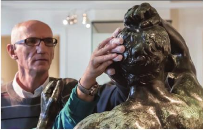
■ Een persoon met een visuele beperking (met handschoen) en een persoon zonder visuele beperking (zonder handschoen) nemen een kunstwerk op haptische wijze waar. (Museum M, Leuven)

beleving van kunst speelde in die kosmopolitische ontmoeting een bemiddelende rol. Een aantal van de onderzoeksvragen die van belang kunnen zijn voor de Vlaamse museale wereld, waren: welke zijn de voorwaarden voor een mogelijke kosmopolitische relatie tussen personen met en zonder visuele beperking in musea en wat kunnen de gevolgen hiervan zijn voor musea en de maatschappij?