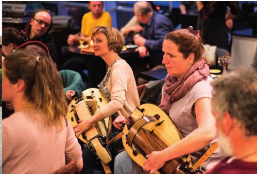
■ Jamsessie na een optreden in TV Limburgcafé te Genk.

“Folkmuziek is zeker van alle tijden, en de populariteit zal misschien met periodes op en neer gaan, maar aangezien het zo nauw met de afkomst van de mensen verbonden is, zal er steeds een onweerstaanbare drang blijven om dit te onderhouden. Op radio en tv is folkmuziek (in tegenstelling tot bijvoorbeeld in Oost-Europa) spijtig genoeg nog onderaanwezig. Hopelijk komt daar nog verandering in (M).”