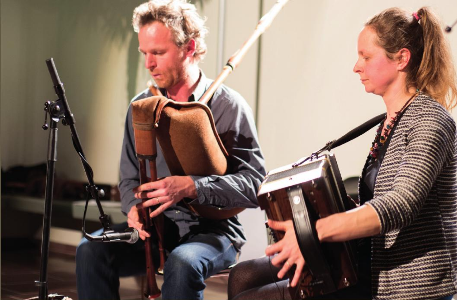
■ Modernistisch folkduo uit Lummen.

Een belangrijk probleem bij het bepalen van het onderzoeksterrein was de afbakening van het genre volksmuziek/folk. We zijn uitgegaan van de definitie die Wim Bosmans geeft in zijn standaardwerk Traditionele muziek uit Vlaanderen 7 :