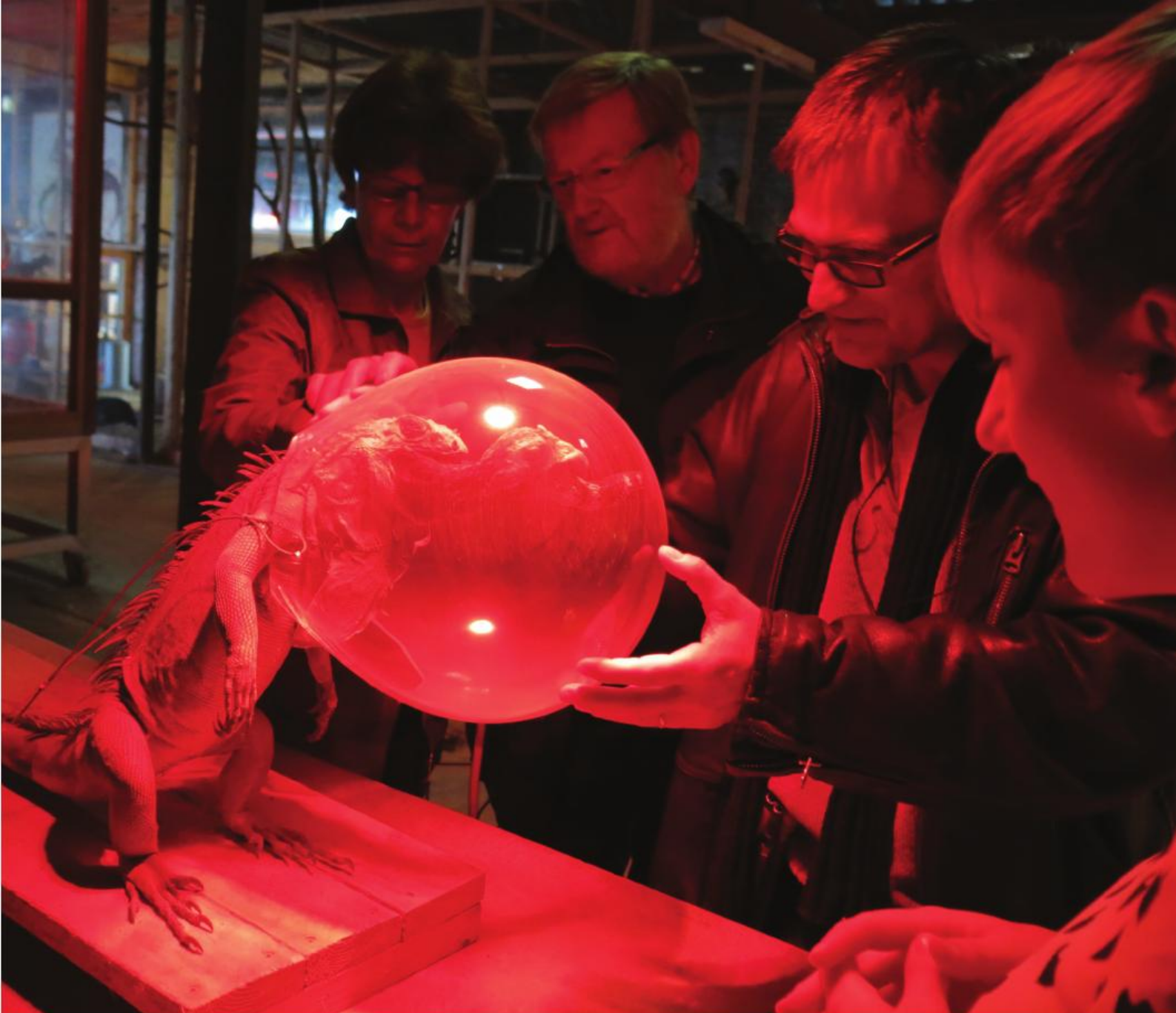
■ Het kunstwerk 'tussenin': de opstelling van de mensen rond het kunstwerk en de haptische waarneming van het kunstwerk brachten dialoog tussen personen met en zonder visuele beperking op gang. (Kunstatelier Vanmechelen, Hasselt)

“Wat ik grappig vond, dat die ... die gezichtjes niet gezien had ...” “Neen, die hadden ze niet gezien, dat wisten ze niet. Ze wisten niet voor wat dat diende, en jij voelde, ah maar dat is een gezichtje.” “En toen dat zij dat zei dacht ik: ‘Och ja, kijk hier, een neusje en ...!’ En dan ineens krijgt dat een duidelijker beeld.” “Dat vind ik boeiende dingen, je ziet het niet maar je voelt het wel.” (Fragment uit citaat: drie personen (met en zonder visuele beperking) over kunstbeleving in een Brussels museum, 2014)