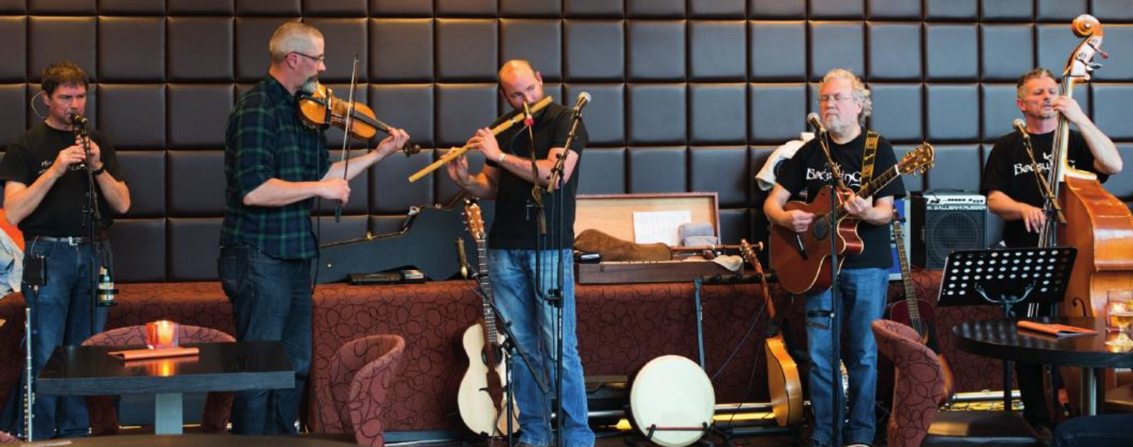
■ Botswing, Schots-Ierse ambientegroep uit Heusden-Zolder.