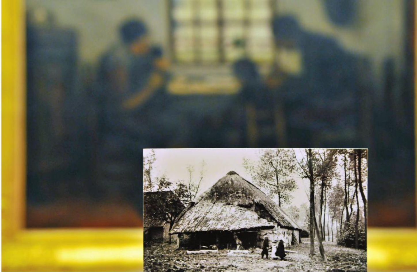
■ Foto van een oude Kempische hoeve.

diens wil gezocht te worden (is het een ongeval?). Anderzijds is er het niveau van de oorzaak . Hierbij maakt Vranken het klassieke sociologische onderscheid tussen micro-, meso- en macroniveau; waarbij het eerste het individuele, het tweede het groeps-, gemeenschaps- of organisatieniveau en het derde dat van de maatschappij of samenleving is.