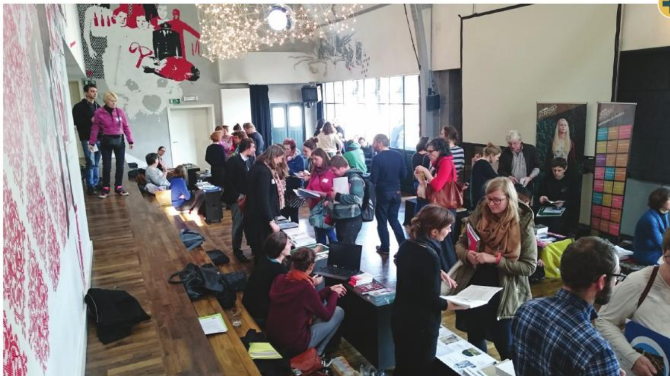
■ BrusselArt Tournée