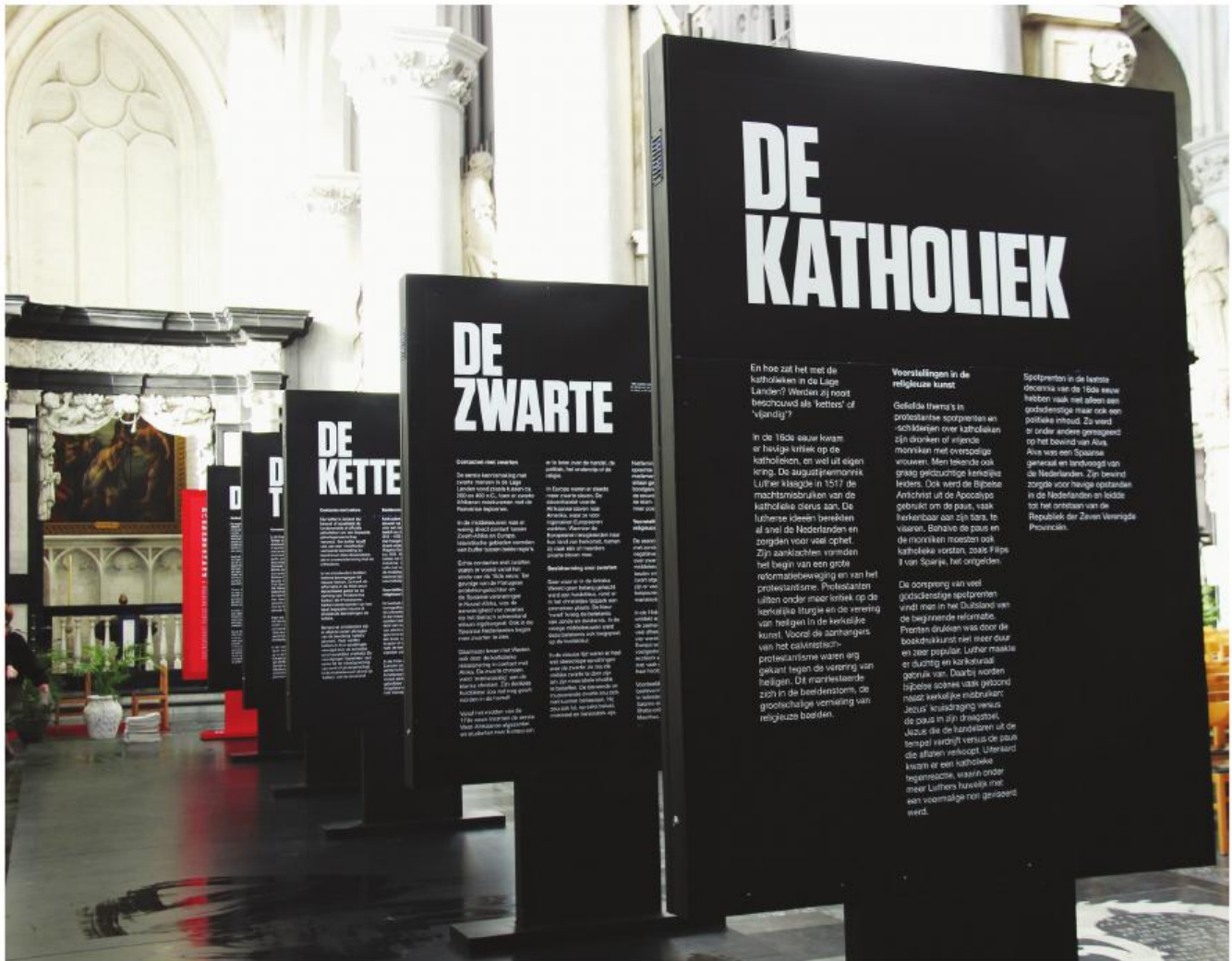
■ De 'andere' werd via enkele thema's, soms positief, soms uiterst negatief, in beeld gebracht: de katholieke, de jood, de zwarte, de ketter en de Turk.

zende karakter van de tentoonstelling, het laten gidsen door vrijwilligers over het hele land, de nieuw uitgetroefde 'beeldragers' en het zoeken naar aansluiting bij een hele reeks lokale of andere (overkoepelende) initiatieven zoals Erfgoeddag.