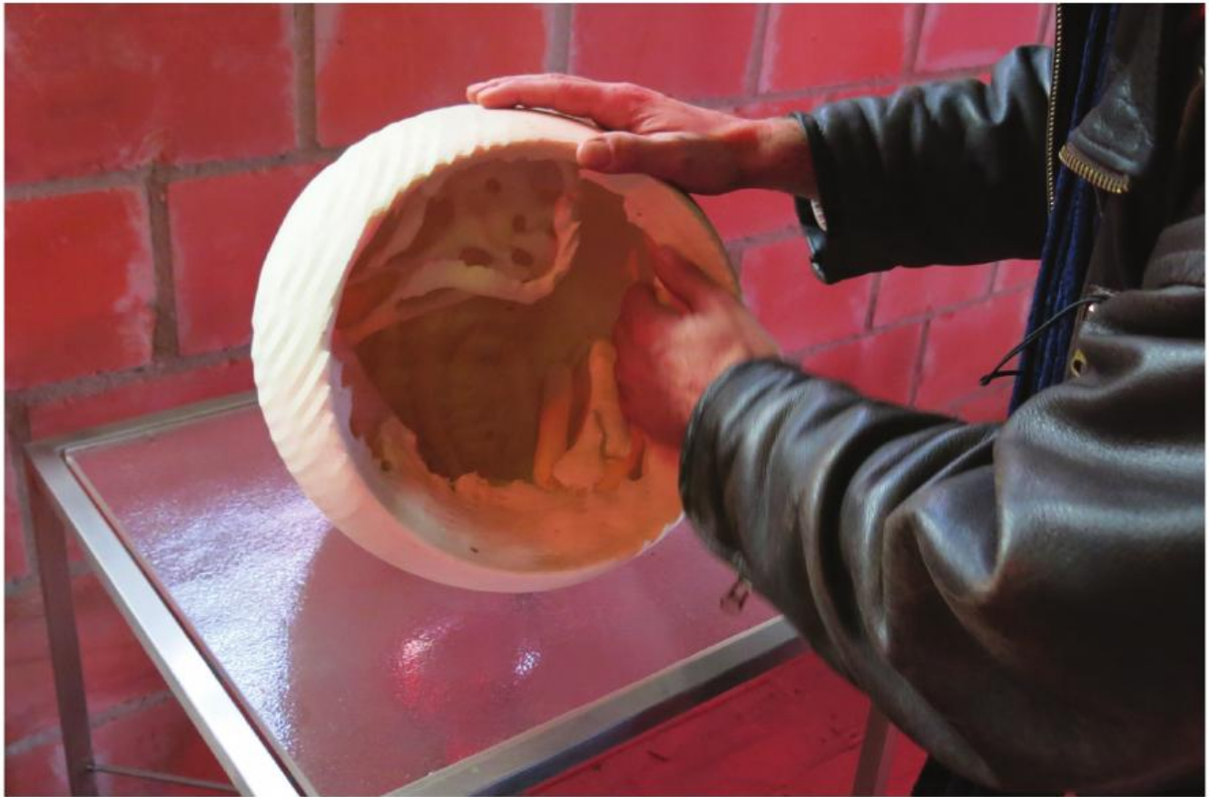
■ Een persoon met een visuele beperking bevoelt een kunstwerk in 3D-print van Koen Vanmechelen. (Kunstatelier Vanmechelen, Hasselt)

beter te begrijpen. Het kan tegen vooroordelen werken en men beschouwde het als een middel tegen kleinerend of beoordelend gedrag. Voor sommige groepsleden ging het ook om vertrouwen en empathie en het daardoor misschien in staat zijn om zich aan te passen. 7 Het draaide volgens hen ook om het 'er zijn' voor, bij of naast elkaar, om het 'samen aanwezig zijn in het moment', zonder dat een of ander oordeel zou moeten worden uitgesproken.