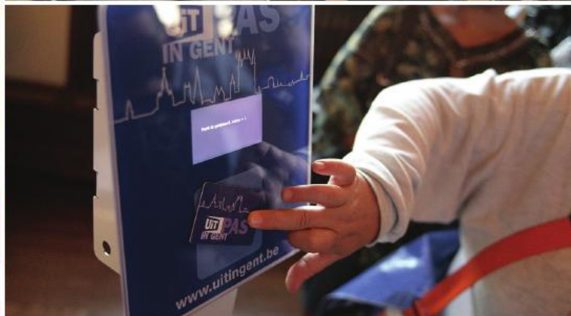
■ Foto boven: de kinderwerking van Centrum Kauwenberg organiseert een eigen vernissage in de tentoonstelling 'De Modernen'. / Foto onder: 'Luisterogen' in het Museum Plantin-Moretus in samenwerking met KOCA.