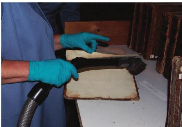
■ Erfgoedbibliotheek Hendrik Conscience zet mensen in bij het ontstoffen van materiaal en boeken.

“Neem niet zomaar iedereen aan, maar kijk goed of deze persoon de taken aankan! Deze mensen hebben vaak al veel narigheid achter de rug en zitten niet te wachten op een volgende mislukking. Maar met een goede motivatie kunnen mensen heel veel aan.”