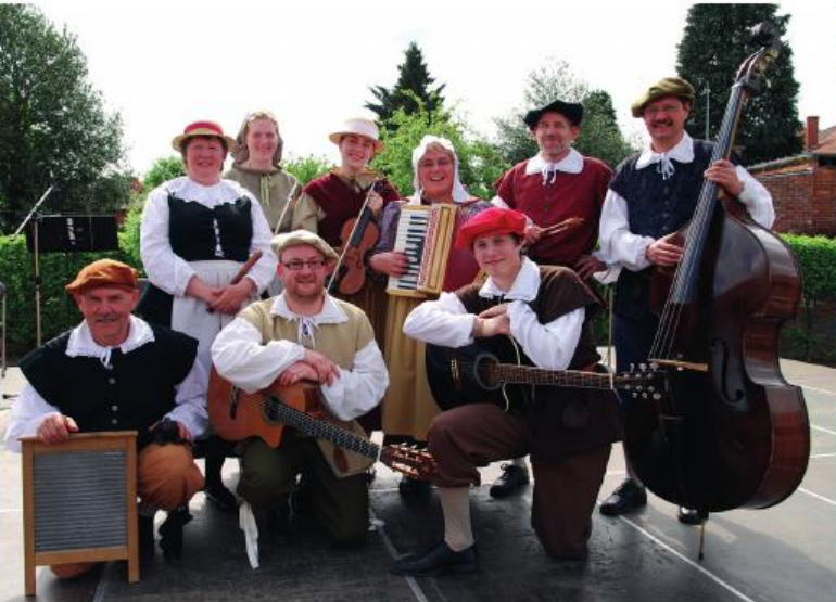
■ De Boezeroenen, volksdansorkest uit Kuringen, Hasselt, in vol ornaat.