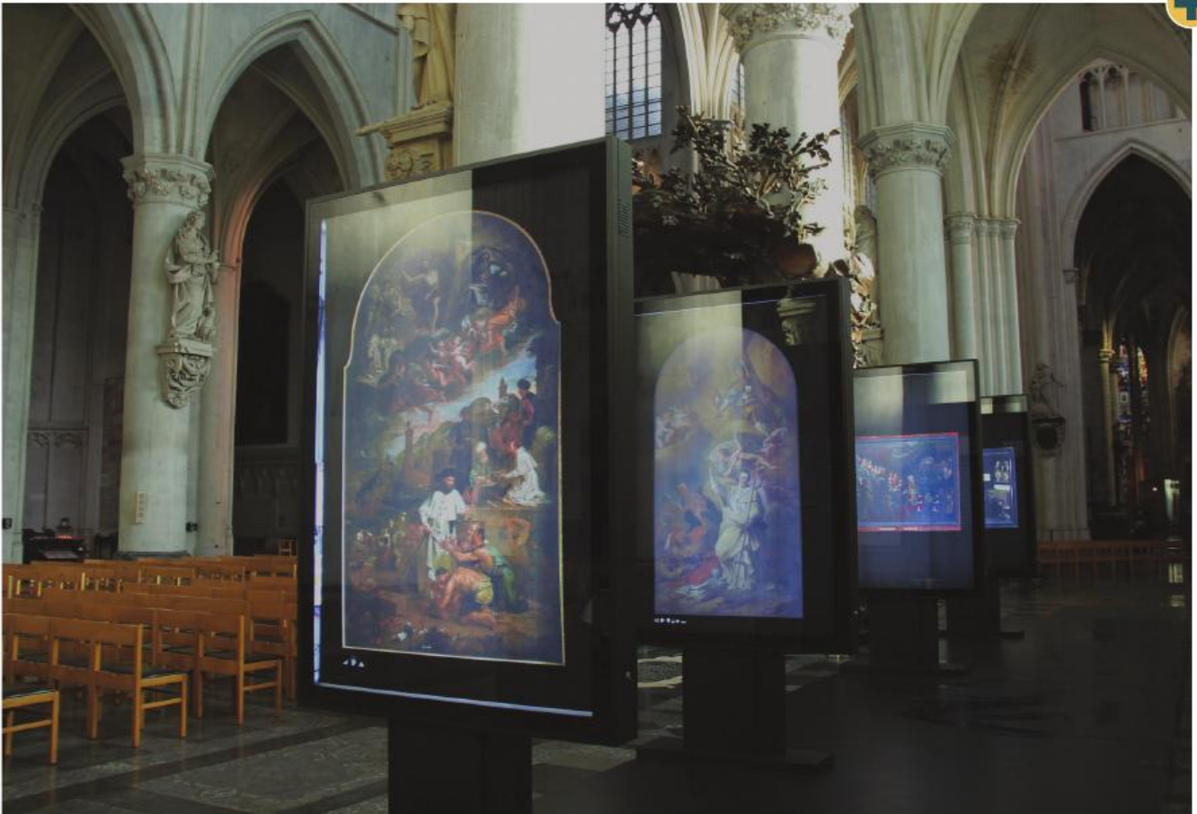
■ De kunstwerken als getuigen van beeldvorming over 'de andere' werden getoond via 'muppies'.

De expo had een zeer duidelijke structuur. Iedere billboard toonde reproducties van één archetype van een welbepaalde 'andere': de jood, de zwarte, de Turk, de ketter, de katholiek. Deze archetypes werden nadrukkelijk benoemd (bv. 'de jood') en symbolisch gerepresenteerd aan de hand van een stereotiep icoontje. Zo maakten we meteen attent op het naïeve en het infantiele van dergelijke stereotypes. Elk stereotype is immers een sterk versimpelde weergave van de realiteit.