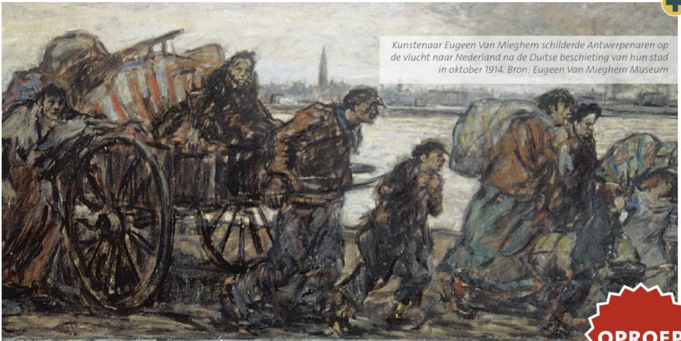
Kunstenaar Eugène Van Mieghem schilderde Antwerpenaren op de vlucht naar Nederland na de Duitse beschieting van hun stad in oktober 1914.